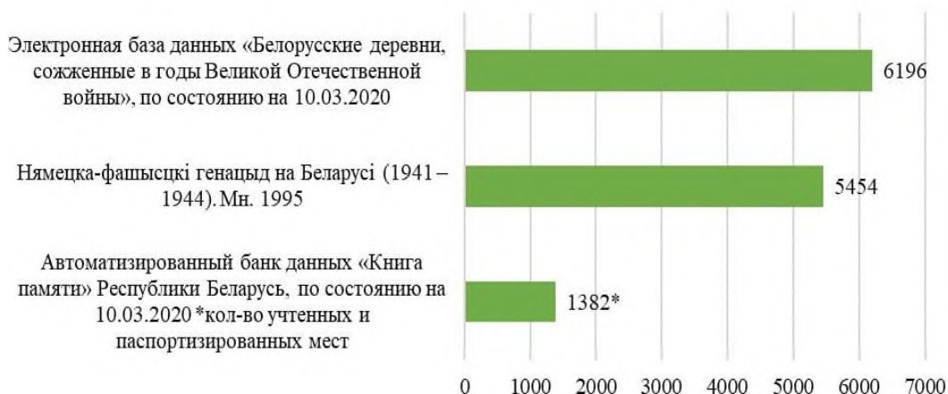
Диаграмма 1. Кол-во населенных пунктов Беларуси, сожженных полностью или частично с жителями в период 1941 -1944 гг.

По состоянию на 10 марта 2020 г. по официальным данным Управления по увековечению Министерства обороны Республики Беларусь документально зафиксировано 6 829 захоронений периода Второй мировой войны, из них захоронения жертв войны – 1 382 [24], что на 2 % больше, чем на момент сентября 2019 г. (1 362 захоронения) [24]. В данных захоронениях увековечены имена 2 069 465 человек, из них жертвы войны составляют 1 030 196 человек [24]. Относится к этим данным нужно критически с той точки зрения, что период Второй мировой войны шире, чем Великой Отечественной войны, но в любом случае погрешность не будет настолько значительной, чтобы в целом изменить масштаб жертв нацизма.