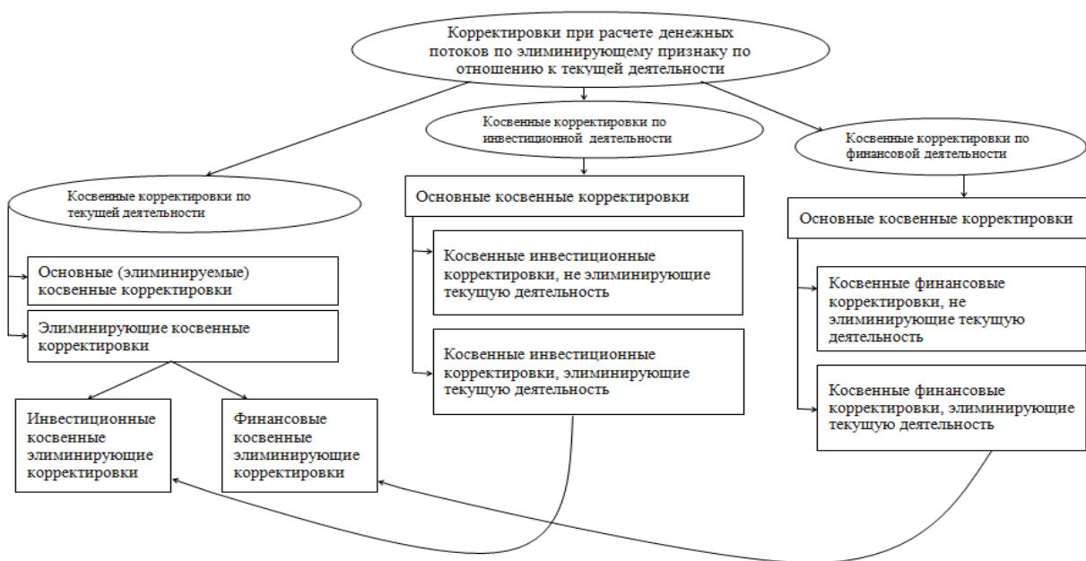
Рис. 2. – Предлагаемая классификация корректировок по элиминирующему признаку по отношению к текущей деятельности