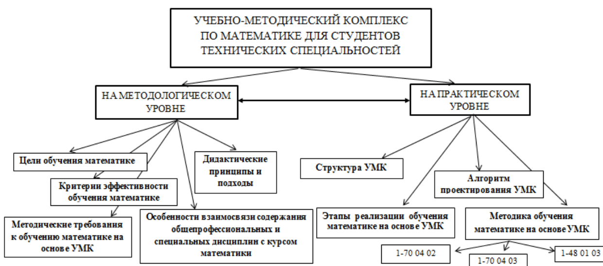
Рис. 1. Графическая схема разработки и реализации УМК по математике

Проведенный анализ результатов исследований по педагогике, теории и методике обучения и воспитания демонстрирует, что вне поля зрения специалистов остаются вопросы разработки УМК как средства повышения эффективности обучения студентов математике с позиции полипарадигмального подхода. Совокупность изложенных выше фактов позволяет актуализировать разработку УМК на методологическом и практическом уровнях. Основные идейные элементы решения поставленной проблемы представлены на рис.1.