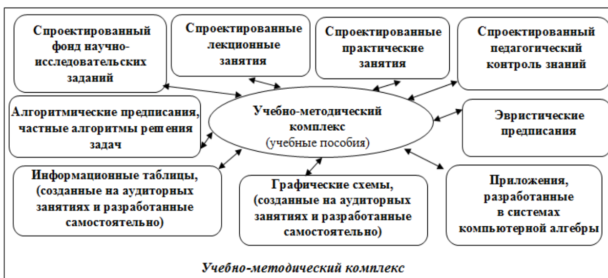
Рис. 2. Структура УМК по математике

На рис.2 изображена структура представляемого УМК.