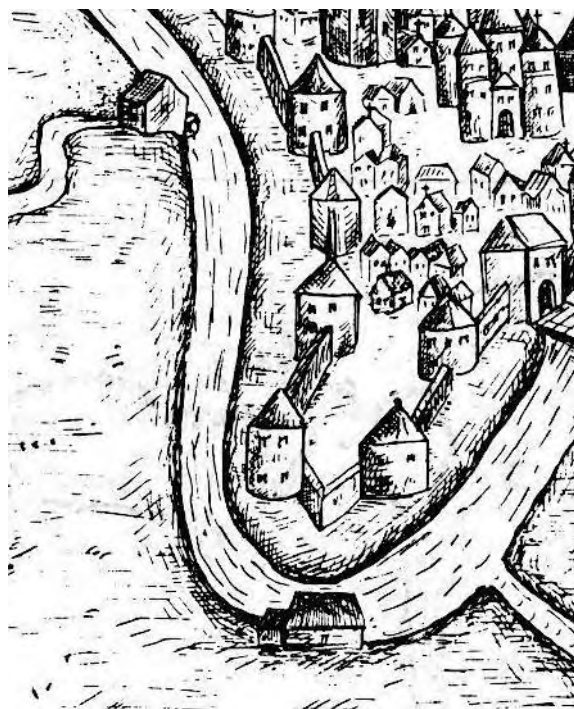
Рисунок 3 – Мельницы на рисунке Пахаловицкого 1579 г.

Во второй половине XVII в. напротив проездных ворот с Нижнего замка к Полоте размещалась мельница [9, с. 284]. На плане Пахаловицкого от 1579 года мы можем видеть две мельницы у полоцкого замка (рис. 3), а на планах XVIII в. сохранилась только одна из них, на стыке Верхнего и Нижнего замков.