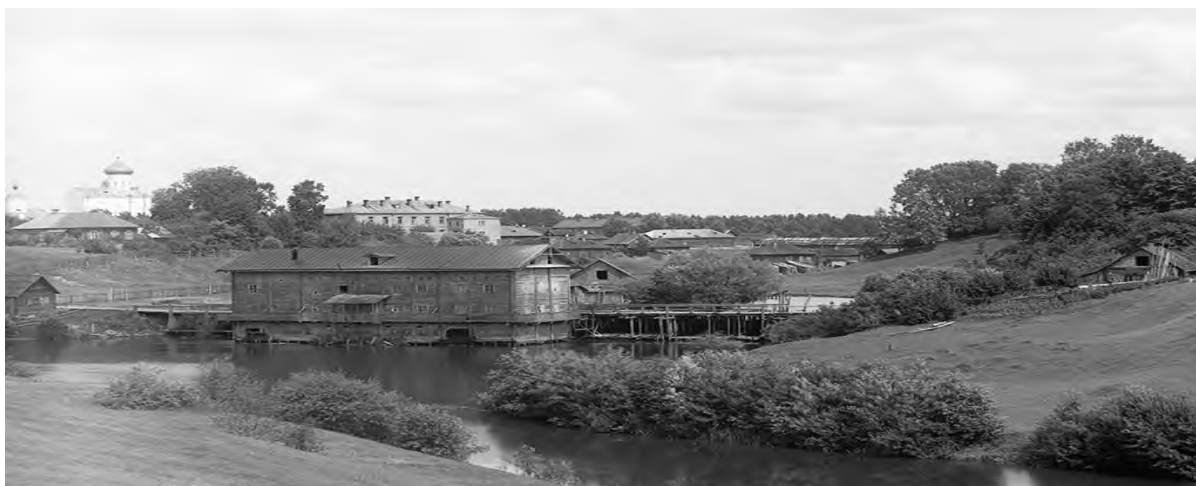
Рисунок 4 – Мельница и плотина на реке Полота в городе Полоцк. Фрагмент фотографии Прокудина-Горского начала XX в.

Однако производство становится мелкотоварным, что является признаком зарождения капиталистических отношений. К этому явлению можно отнести и рост нецехового ремесла, дифференциация среди ремесленников, а также усиления связи со скупщиками. Появились профессии: слесарная, котельничкая, серебряная, а также увеличилось количество сапожников и кузнецов.