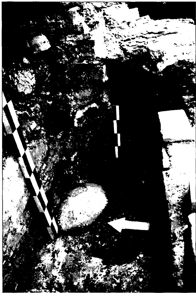
Аркасная ніша ў паўднёвай сцяне, заходняя сценка, від з усходу і захаду.

Спаса-Праабра- жэнскі храм Спаса- Еўфрасіннеўскага манастыра. План- рэканструкцыя храма XII ст. (варыянт 2017 г.)