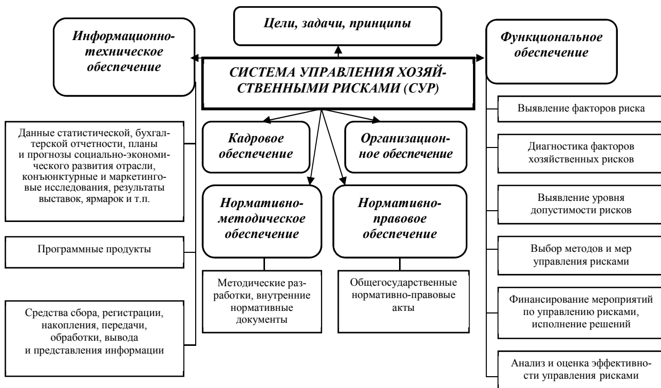
Рис. 2. Система управления хозяйственными рисками

– предложен детализированный процесс управления рисками, что позволило выделить три стадии, в том числе диагностику риск-факторов (рис. 3);