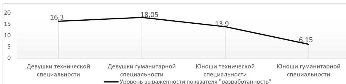
Рисунок 2. – Различия средних значений разработанности у студентов технических и гуманитарных специальностей

Выявленные различия рассмотрим на рисунке 2.