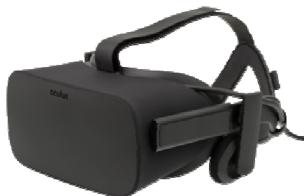
Рисунок 5. – Oculus Rift

Oculus Rift. В очках Oculus Rift (рис.5) для формирования стереоэффекта не используются затворы или поляризаторы. Изображения для каждого глаза выводятся на один дисплей рядом (каждое изображение занимает немного меньше половины дисплея), затем геометрия изображения корректируется при помощи линз для увеличения поля зрения [7].