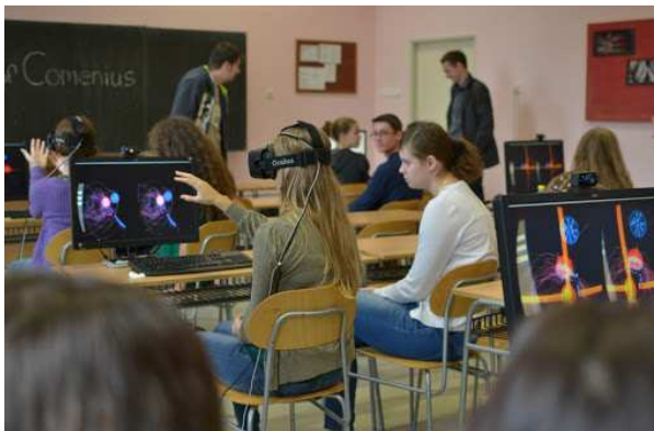
Рисунок 2. – Дети на уроке с приборами виртуальной реальности

Реализуя принципы наглядности, активность учащихся, приближенность к жизни, обучение с использованием технологий виртуальной реальности существенно ускоряет процесс усвоения материала детей с ограниченными возможностями (рис.2) [4].