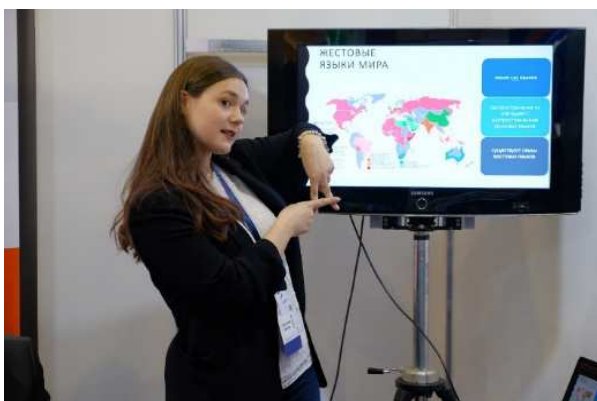
Рисунок 3. – Язык жестов

Данные приборы виртуальной реальности будут отображать видео-уроки на различные темы, не обязательно присутствовать в определенное время на уроке, таким образом это может облегчить жизнь человеку с ограниченными возможностями здоровья. Видео-урок можно посмотреть в любое время (рис. 3). Также по желанию учащегося можно включить функцию отображения текста, если учащемуся привычнее и легче читать, чем смотреть на учителя, который использует дактилологию для объяснения темы. Данный способ подойдет для тех, кто еще плохо знаком с «языком жестов». Благодаря расширенному полю зрения, которое присутствует в приборах, учащийся будет чувствовать себя, как на полноценном уроке в школе [5, с.1].