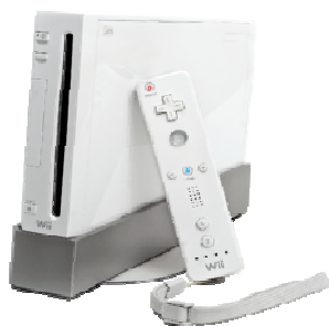
Рисунок 7. – Nintendo Wii

Благодаря разным приспособлениям виртуальной реальности, занятия будут в домашних условиях. Как выявили ранее, существует огромное количество заболеваний у детей, а это значит, что каждый случай обучения индивидуален и будет использоваться нужное приспособление.