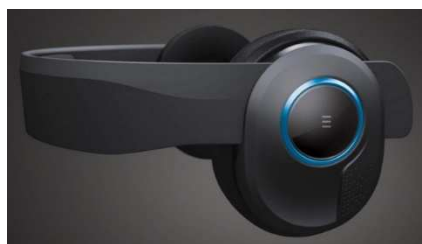
Рисунок 6. – Avegant Glyph

С использованием виртуальной реальности могут являться различные уровни сложности заданий и событий, когда моделируется ситуация, мотивирующая преодолеть собственный результат. Так, установлено, что при разработке движений с помощью игровой приставки Nintendo Wii (Япония) с периферическим устройством, отслеживающим положение тела и движения — Balance Board (Nintendo of Korea).