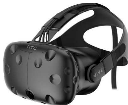
Рисунок 4. – HTC Vive

Oculus Rift. В очках Oculus Rift (рис.5) для формирования стереоэффекта не используются затворы или поляризаторы. Изображения для каждого глаза выводятся на один дисплей рядом (каждое изображение занимает немного меньше половины дисплея), затем геометрия изображения корректируется при помощи линз для увеличения поля зрения [7].