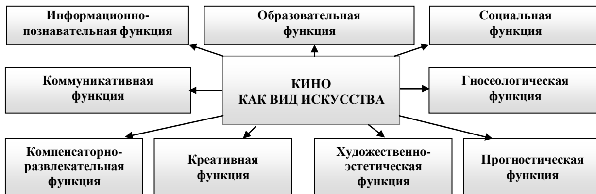
Рис. 2. Функции кино как вида искусства

Перечисленные группы потребностей реализуются благодаря возможностям кино, выражающимся в ряде функций. Выделим основные из них (рис. 2).