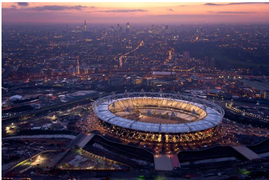
Рисунок 1. – Олимпийский стадион в Лондоне

После гигантского Олимпийского стадиона в Пекине, организаторы Олимпийских Игр в Лондоне создали необычную разборную конструкцию для основной арены Олимпиады 2012. Обычно спортивных архитекторов просят создавать целые спортивные дворцы, способные прослужить на протяжении десятилетий. Однако новый Олимпийский стадион в Лондоне (рис. 1), на котором 27 июля 2012 года прошла торжественная церемония открытия Игр, сооружен с абсолютно другим прицелом: при необходимости он должен разбираться. Именно таким стал британский ответ на манию гигантизма, охватившую современную олимпийскую архитектуру: выше, быстрее и дороже.