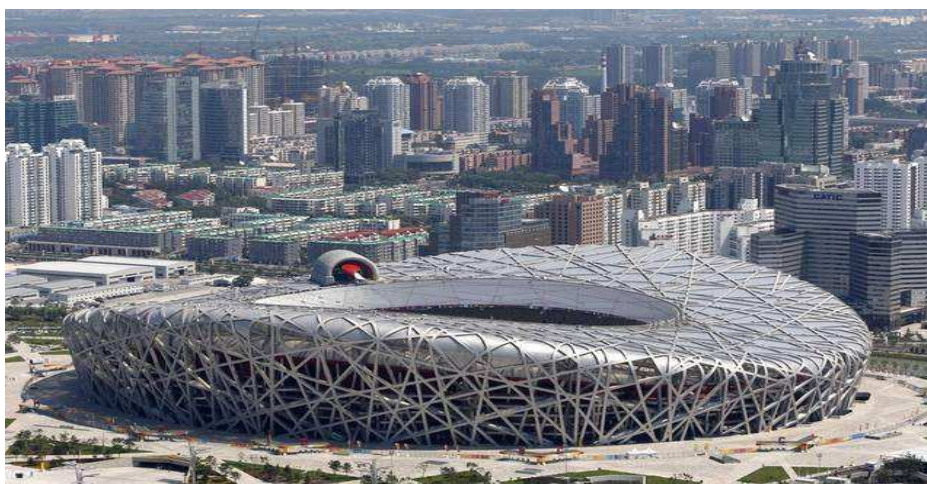
Рисунок 1. – Пекинский национальный стадион

Был объявлен международный тендер выиграть который удалось швейцарцам, у которых уже был проект будущей жемчужины олимпийской короны, но в нем не хватало одного – амбиций принимающей нации и китайской изюминки. Для решения этого вопроса к созданию главной спортивной площадки привлекли дизайнера, у которого история Китая была в крови - Ай Вэйвэй. Этот человек фрагментирует образцы древних артефактов для создания собственных произведений искусства, он показал компании те новые идеи, формы и рассказал, как это будет восприниматься. При этом удалось уйти от традиционного китайского дизайна. Концепция общего вида из клубка ниток воодушевила проектировщиков, овал, обвитый неразрывными клубками пряжи внутри которого спортивная арена (рис. 1).