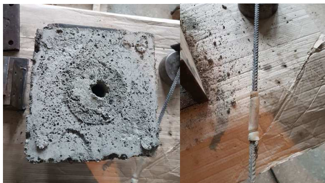
Рисунок 2. – Состояние арматурного стержня и куба из пенобетона после нарушения сцепления