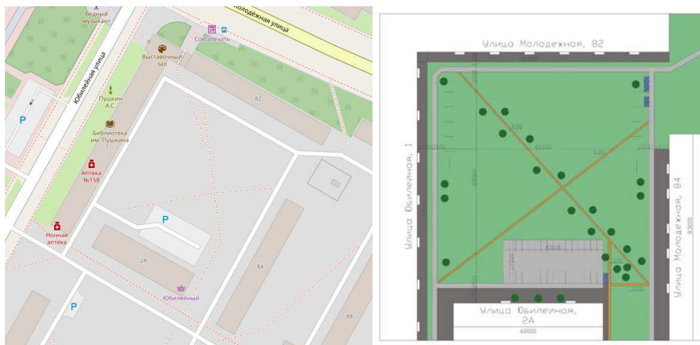
Рисунок 1. – Опорный план территории

Далее, для наибольшей наглядности, будет проведен анализ одного из дворовых пространств города Новополоцка, расположенного на пересечении улиц Молодежная и Юбилейная (рис. 1.).