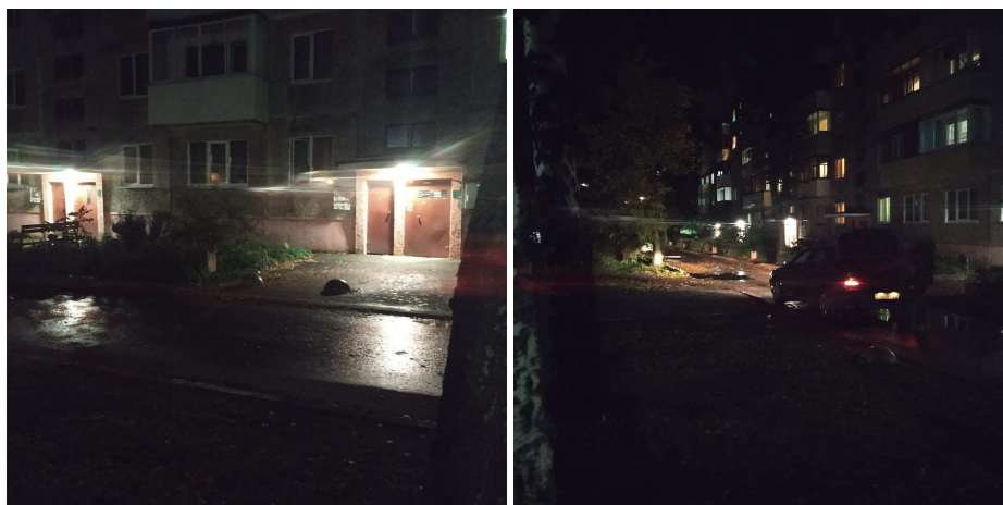
Рисунок 3. – Освещение территории