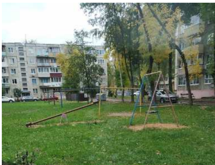
Рисунок 4. – Детская площадка

– отсутствуют организованные игровые, спортивные площадки, площадки для отдыха взрослого населения, для выгула собак, их благоустройство представлено несколькими малыми формами (пара качелей, стойки для сушки белья) (рис. 4.);