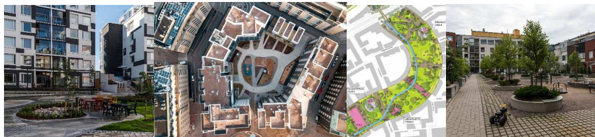
Рисунок 4. – Жилой район «Яткасаари», Хельсинки

Элементы благоустройства дворовой территории