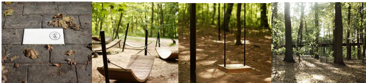
Рисунок 2. – Элементы благоустройства «Илавский лес», Польша

Илавский лес в Польше. Проект призван возродить заброшенную городскую природу за счет безопасного использования пространства, предназначенного для широкого круга пользователей - пеших прогулок, бега трусцой, езды на велосипеде. Это так же формирует привычки здорового образа жизни у горожан. Территория предполагает ее использование людьми разного возраста, независимо от физических возможностей - склоны и тропы пологие, а система навигации разработана с учетом потребностей людей с ограниченными возможностями (рис. 2-3) [1].