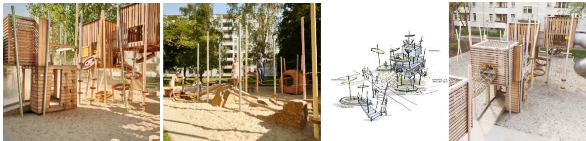
Рисунок 1. – Детская площадка, Берлин. Элементы благоустройства площадки

ственные места пользования для взрослых, где они могут проводить свободное время. Рассматривая ее с экологичной точки зрения, то данный объект имеет благоприятное влияние на окружающую застройку и за счет использования такого материала, как дерево, создается непосредственное единение с окружающей природой.