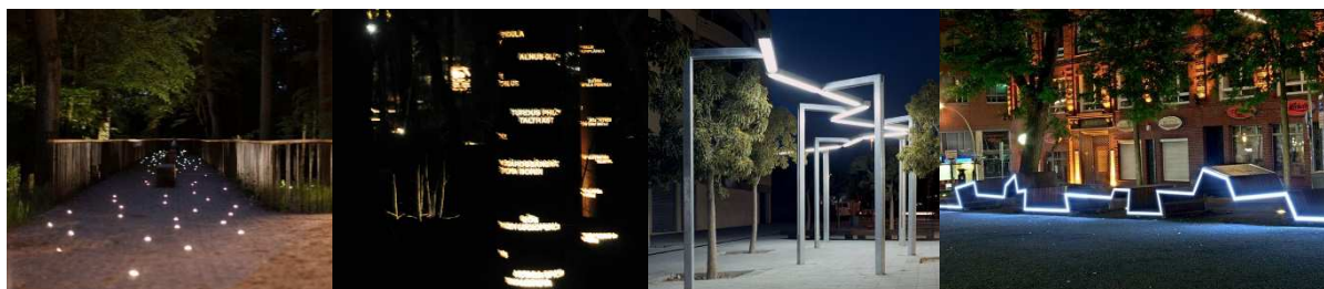
Рисунок 3. – Элементы благоустройства территории