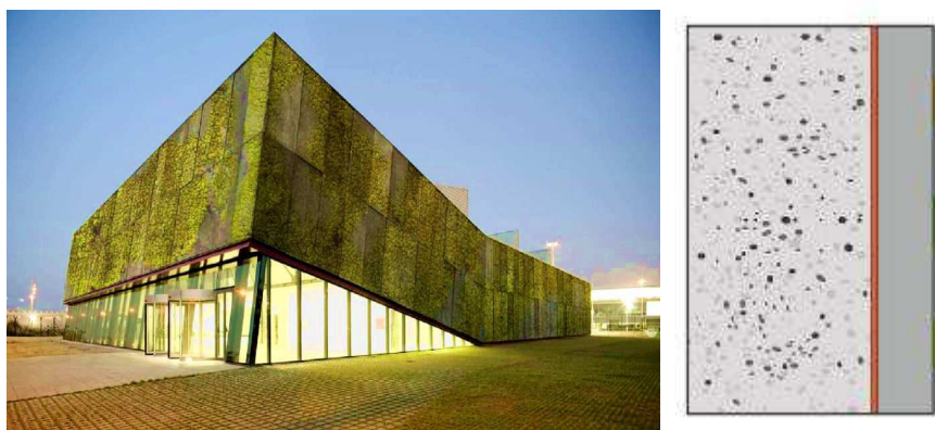
Рисунок 2. – Навесная многослойная панель

Отмечая оригинальность разработки, следует отметить, что применение фосфатно-магниевого цемента требует строгого регулирования скорости реакции цемента с затворителем - фосфорной кислотой и набора прочности: через 1 ч прочность на сжатие цементного камня составляет до 14 МПа, через 1 сутки до 150 МПа. Это потребует дополнительных технологических операций при производстве облицовочных панелей. Кроме того, применение фосфатно-магниевого цемента не только в Беларуси но и в России ограничено: в Беларуси данное вяжущее не производят, в России его выпускают для нужд стоматологии. Основными импортёрами являются Китай, Индия, Пакистан, стоимость 1 тонны цемента составляет 300÷1000$. (Рис.2) [3].