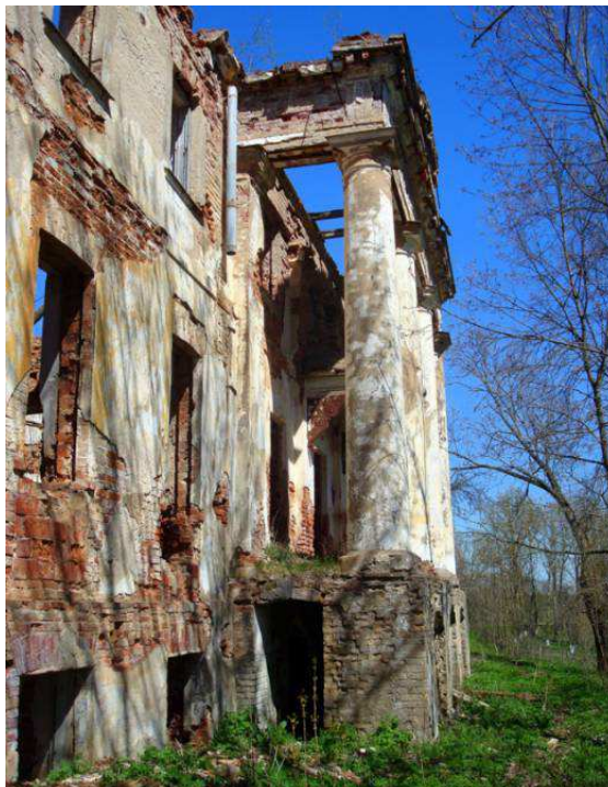
Рисунок 2. – Порттик со стороны южного фасада

На втором этаже в пространствах портиков с двух сторон над входами были балконы. Сейчас от них мало что осталось: хорошо сохранились лишь чугунные консоли, поддерживавшие балконы, красивые кованые балконные ограждения над главным входом были утеряны, хотя существовали ориентировочно до 2007 года.