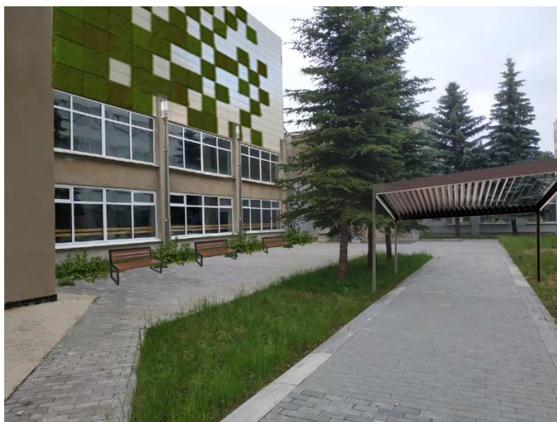
Рисунок 2. – Вариант благоустройства внутреннего двора нового корпуса

Таким образом, можно сделать вывод, что благоустройство территорий способствует формированию благоприятной для жизнедеятельности человека среды, а также представляет собой ряд мероприятий по планировке и озеленению существующих и создания новых территорий.