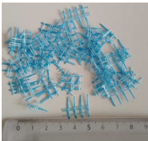
Рисунок 1. – Отходы производства щелочестойкой стеклосетки ССШ-160(100)-1800/1800

Отходами являются обрезки щелочестойкой стеклосетки ССШ-160(100)-1800/1800 (рис. 1). Основные характеристики волокна представлены в таблице 1.