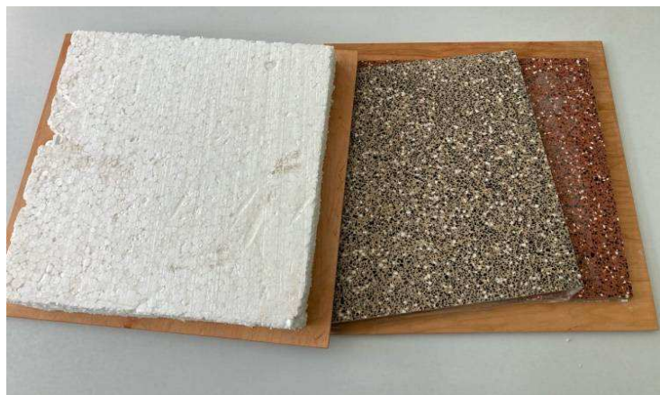
Рисунок 1. – Образцы наливного пола