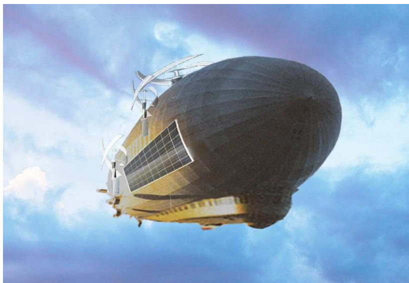
Рисунок 1. – Общий вид ТНА-дирижабля (образное решение)

В настоящем исследовании рассматривается как ТНА-дирижабль сам по себе, так и вся система «ТНА-дирижабль и соответствующая инфраструктура». Одно из эскизных образных изображений ТНА-дирижабля представлено на рис. 1.