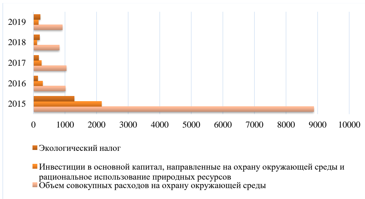
Рисунок 2. – Экономические возможности зеленого роста в Республике Беларусь в 2015-2019 годах

Далее представлен анализ такого параметра зеленого роста, как экономические возможности (рисунок 2).