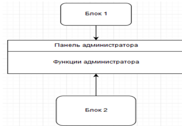
Рисунок 2. – Макет интернет-магазина автозапчастей административной части

Рассмотрим так же макет административной части сайта. На рисунке 2 представлен макет административной части сайта.