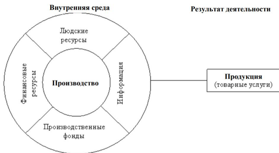
Рисунок 1. – Структура экономического потенциала организации

По мнению В.Ф. Протасова и А.В. Протасовой [1], экономический потенциал организации (предприятия) характеризуют следующие компоненты внутренней и внешней среды: людские ресурсы, средства производства, финансовые ресурсы, информация (рисунок 1).