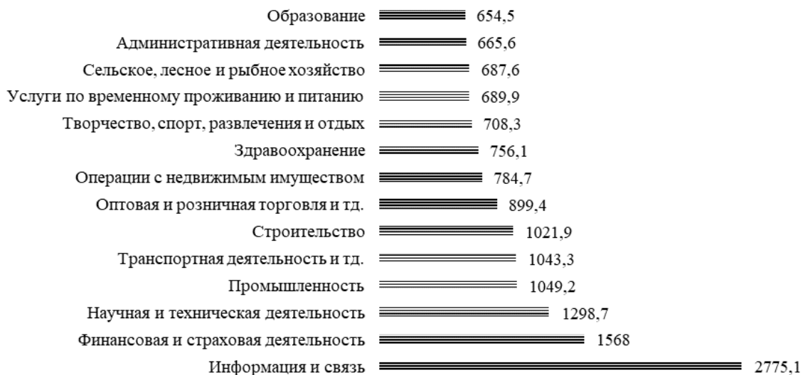
Рисунок 1. – Номинальная начисленная средняя заработная плата работников Республики Беларусь по отдельным видам экономической деятельности за 2018 г., руб.

Ключевым критерием при оценке ИТ-рынка являются зарплата и ставки специалистов. Уровень заработной платы в Беларуси в секторе ИТ превышает средний уровень зарплат в стране примерно в 3 раза (рисунок 1). Средняя зарплата в секторе ИТ на начало 2019 года составляет 1849 долл. США (+5% к началу 2018 года) и является одной из самых высоких в стране. Тем не менее, в сравнении со многими государствами-экспортерами ИТ-услуг зарплата белорусских ИТ-специалистов является довольно низкой, что и является основным конкурентным преимуществом Беларуси [4].