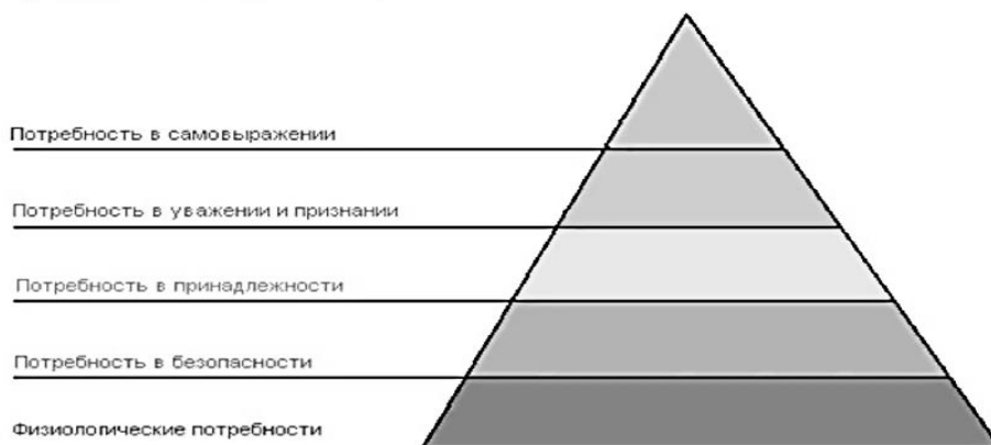
Рисунок 1. – Пирамида потребностей А. Маслоу