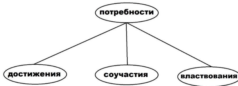
Рисунок 3. – Теория приобретенных потребностей Д. Макклелланда. Источник: [9, с. 165].

Если все предыдущие теории подразумевали тесную взаимосвязь процессов удовлетворенности и неудовлетворенности, то абсолютно новым в концепции американского социального психолога, специализирующегося на проблемах труда и деятельности компаний Фредерика Герцберга становится его вывод о том, чувства удовлетворения и неудовлетворения индивида являются двумя противоположными процессами, не связанными между собой. То есть то, что какой-либо фактор способствует росту удовлетворенности, не означает, что при ослаблении влияния этого фактора будет расти неудовлетворенность [9, с. 168].