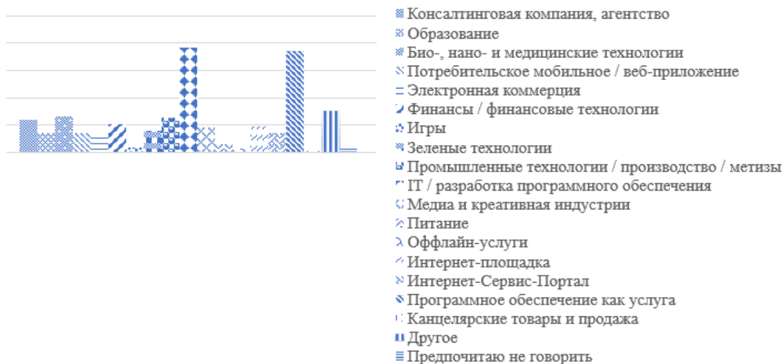
Рисунок 2. – Отрасли европейских стартапов