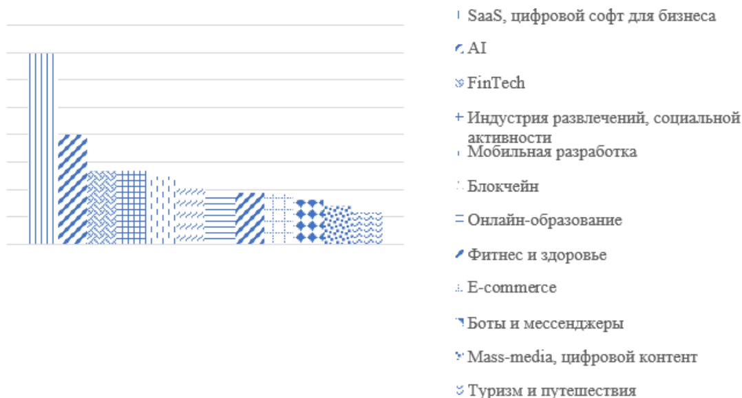
Рисунок 1. – Отрасли белорусских стартапов

Сектора в которых работают стартапы разнообразны. Самыми популярными отраслями среди белорусских стартапов являются SAAS, искусственный интеллект, технологии в области финансов, а также игры и развлечения (рисунок 1).