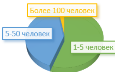
Рисунок 3. – Количественный состав белорусской команды стартапа

Большее половины опрошенных белорусских стартапов имеют не больше пяти человек в команде. Средняя численность работающих в стартапе – 7 человек (рисунок 3).