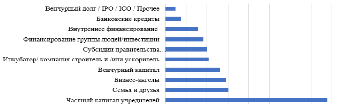
Рисунок 4. – Источник финансирования европейских стартапов

В отличие от европейских компаний, где каждый пятый стартап получает государственное финансирование (рисунок 4), у белорусских стартап-компаний нет такой возможности (рисунок 5).