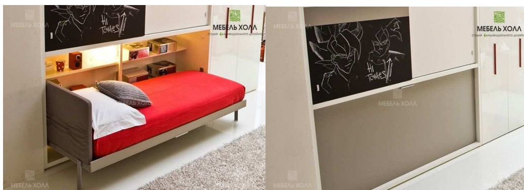
Рисунок 1. – Трансформируемая- кровать фирмы "Мебель Холл"

Большое разнообразие зарубежных и отечественных мебельных фирм, таких как: "Clei", "Mebelin", "Мебель Холл" и др., позволяет дизайнерам подобрать продукцию, обладающую всеми технологическими и эстетическими критериями, либо спроектировать мебель на основе аналогичных существующих моделей (рис. 1).