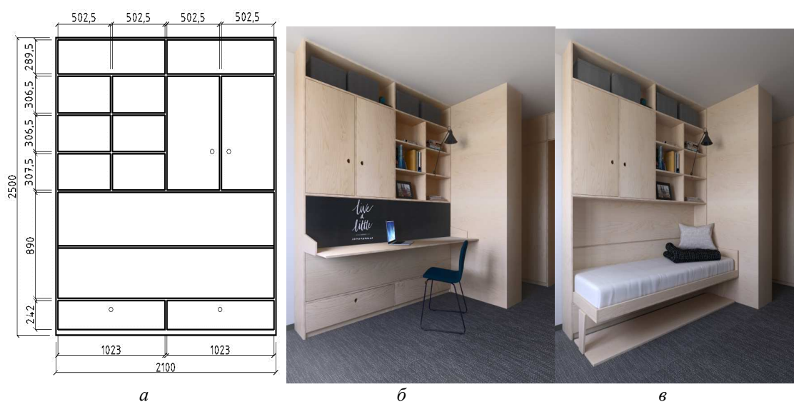
Рисунок 5. – Модуль № 2 второй многофункциональной зоны: а – схема; б, в – 3d визуализация

Трансформируемая мебель в данной зоне представлена в 2-х видах модульных блоков. Общие габариты блоков в закрытом состоянии составляют 2100x300x2500 мм. В первый модуль входят: рабочий стол, одно спальное место, ящики и полки, предназначенные для хранения вещей. Трансформация блока осуществляется преобразованием (опускание на напольную поверхность) рабочего стола в спальное место для одного человека. Габариты рабочего стола составляют 500x2100 мм. При трансформации образуется кровать, предназначенная для одного человека, размерами 900x2100 мм. Для открытия кровати использован вертикальный механизм "Шкаф-кровать". Фасады распашного шкафа крепятся на вкладные петли. Для ящиков использованы специальные выдвижные механизмы (рис. 5).