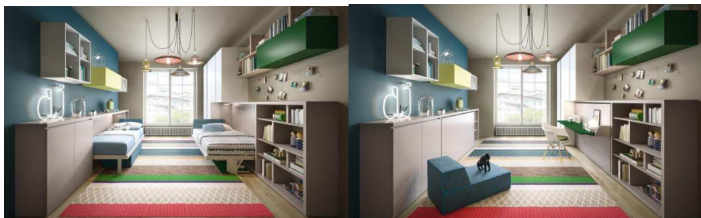
Рисунок 2. – Трансформируемы кровати фирмы "Clel"

Standard (с горизонтальной односпальной кроватью шириной 90 см и промежуточной шириной 120 см), платой (односпальная или промежуточная кровать, со столом) (Рис.2) [4].