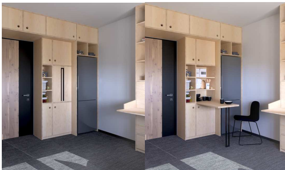
Рисунок 4. – 3d визуализация модуля №1 первой многофункциональной зоны

Для каждого человека в комнате необходимо отдельное рабочее место, его можно сформировать внутри одного из отделений шкафа, сделать откидную или передвижную столешницу. Такое рабочее место при необходимости можно будет убирать обратно в шкаф. Для хранения вещей в комнате можно повесить несколько полок, открытых шкафчиков или рейлингов. Так же возможен вариант соединения всех необходимых единиц мебели в один трансформирующийся блок.