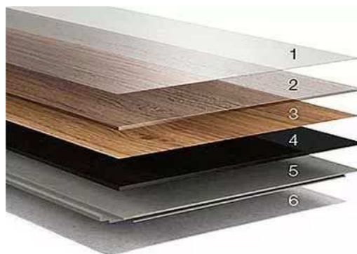
Рисунок 3. – Структура покрытия пола Арт-винил: 1 – износостойчивый полиуретановый слой; 2 – прозрачный виноловый защитный слой; 3 - декоративный слой винила; 4 – основной виноловый слой; 5 – влагонепроницаемая основа; 6 – звукоизоляционный слой