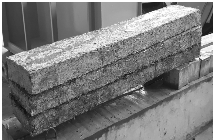
Рисунок 2. – Неизвлекаемый вкладыш-пустотообразователь из прессованной соломы

В УО Полоцкого государственного университета разработан и предложен новый экологический материал из прессованной соломы в качестве неизвлекаемого вкладыша-пустотообразователя в монолитные плиты перекрытий (рис. 2). Его характеристики показаны в таблице 1.