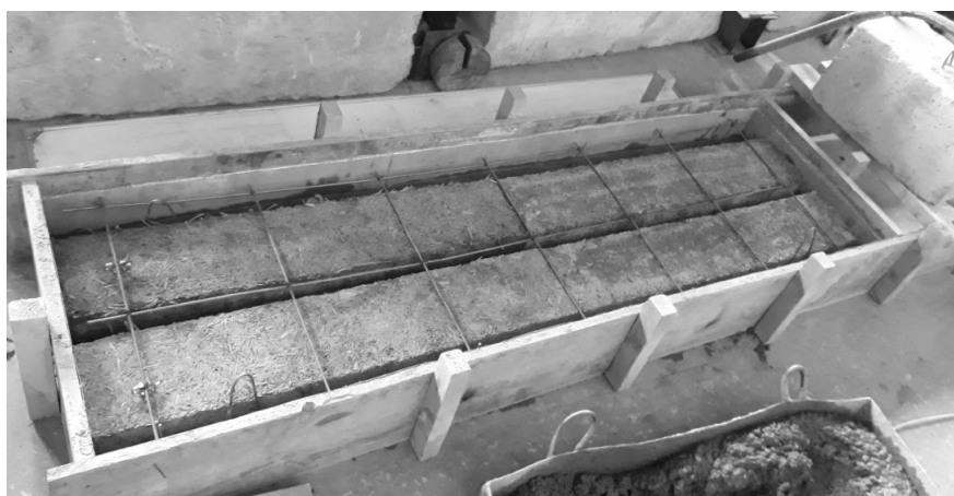
Рисунок 3. – Расположение неизвлекаемого вкладыша-пустотообразователя из прессованной соломы

Расположение экологического материала из прессованной соломы показано на рисунке 3.