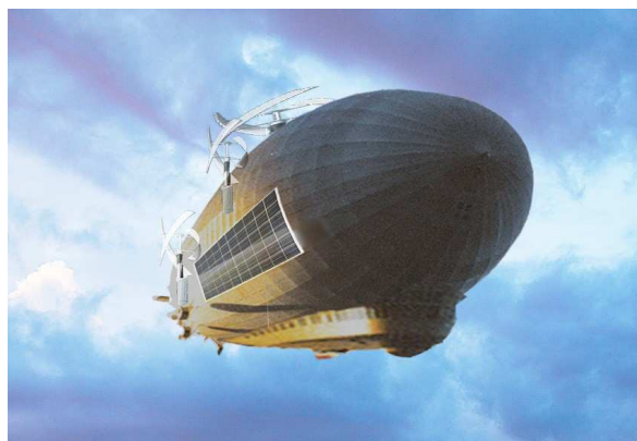
Рисунок 1. – Общий вид ТНА-дирижабля (образное решение)

В настоящем исследовании рассматривается как ТНА-дирижабль сам по себе, так и вся система «ТНА-дирижабль и соответствующая инфраструктура». Одно из эскизных образных изображений ТНА-дирижабля представлено на рисунке 1.