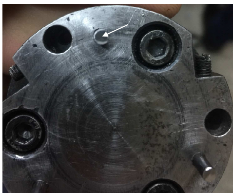
Рисунок 2. – Тёмные полосы износа на образцах

При данных режимах работы невозможно было определить износ, т.к. после прохождения 2000 м отпечатки полностью стирались.