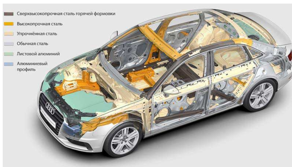
Рисунок 1. – Стальной кузов

Стальной кузов. Стальной кузов может быть различной вариантности сплава, что дает совершенно непохожие свойства его разновидностям. Например, низкоуглеродистая листовая сталь толщиной 0,6–2,5 мм. Листовая сталь обладает отличной пластичностью она же и позволяет производить из себя наружные панели деталей кузова, которые порой могут иметь довольно необычную и сложную форму. Логично, что высокопрочные сорта обладают изрядной энергоемкостью и отличной прочностью, поэтому этот вид стали применяют в производстве силовых деталей кузова (рис. 1).