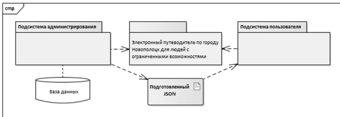
Рисунок 2. – Функциональная структура электронного путеводителя по городу Новополоцку для людей с ограниченными возможностями

В разработанной системе можно выделить четыре компонента (рис. 2).