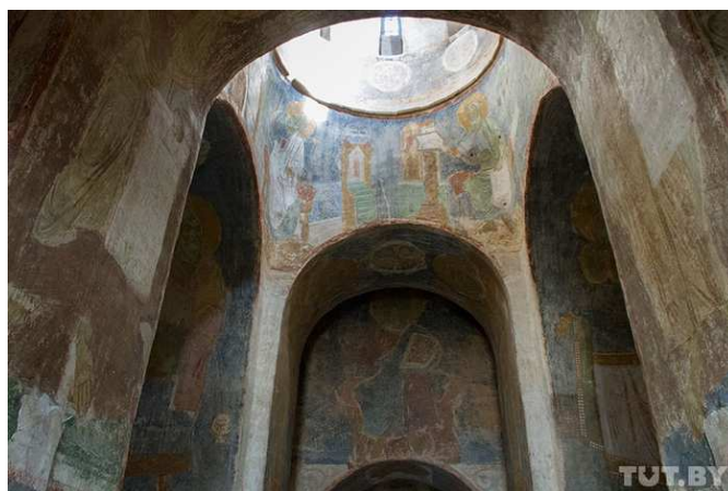
Рисунок 3. – Раскрытые фрески центральной части.

http://поисков.рф/картинка/большая/e34f8a3e9d75b97833f524f396586f09.jpg [3]