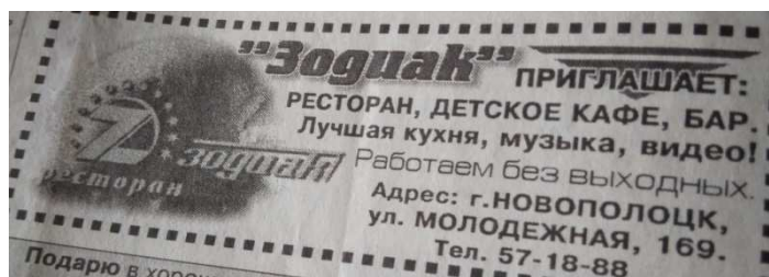
Рисунок 12. – Ресторан «Зодиак» [30]