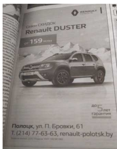
Рисунок 17. – Renault Duster [13]

Печатаются в газете и коммерческие статьи. Статья, посвящённая открытию нового «Диониса», напечатана в выпуске от 18 декабря [4]. Не утрачивают актуальность и простые рекламные объявления. Одно из объявлений напечатано на 15 странице выпуска от 18 декабря 2015 года. Предлагает реклама услуги по ремонту и реставрации мебели [29].