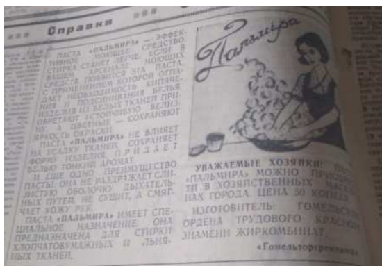
Рисунок 2. – Пальмира [19]

В 1980 году никаких изменений не происходит. Экономическая реклама по-прежнему представлена в виде небольших объявлений, которые иногда содержат иллюстрации. Например, иллюстрированная реклама напечатана в выпуске от 31 июля (рисунок 3) [2].