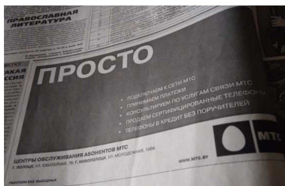
Рисунок 14. – Сеть МТС [31]

А в выпуске от 6 октября 2006 года – реклама тарифного плана «привет всем» от velcom [38]. Появляется в газете и реклама сигарет Viceroy. Реклама сопровождается надписью «Курение опасно для здоровья» (рисунок 15) [43].