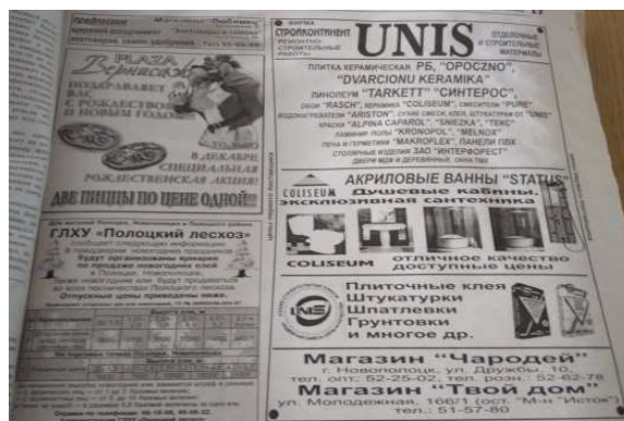
Рисунок 7. – Реклама [25]

Редакторы «Новой газеты» осознавали, что коммерческая реклама может влиять на людей в выгодную для рекламодателя сторону. В номере от 13 октября 1992 года появилось коммерческое объявление «реклама – двигатель прогресса!», которое предлагало читателям размещать свою рекламу на страницах газеты [26]. Тематика коммерческой рекламы была достаточно разнообразной. Стоит отметить, что коммерческая реклама этого года была достаточно разнообразной. Например, в выпуске от 22 декабря 1992 года было напечатано три рекламных объявлений. Первое из них предлагает предприятиям детские новогодние подарки, второе – приглашает на аттракцион «Вальс» [28]. Третье рекламное объявление предлагает застраховать имущество [34]. Рекламирует газета и подписку на периодические издания. Например, в выпуске от 25 сентября 1992 года «Новая газета» предлагает подписаться на газету областного Совета «Народные слова» (рисунок 8) [21].