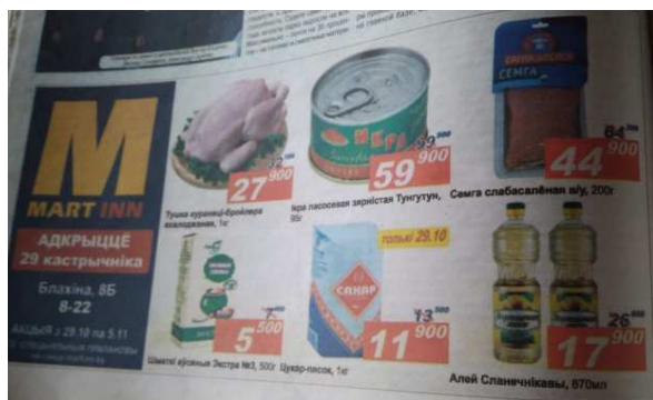
Рисунок 16. –Магазин «Martinn» [11]

В 2015 году «Новая газета» уже носила новое название «Новополоцк сегодня». Изменился и внешний вид газеты: она стала более яркой. В газете печатались цветные фотографии, цветная реклама и т.д. В отличие от уже рассмотренных выпусков, коммерческая реклама этого года была, как правило, цветной. Например, газета рекламирует новополоцкие магазины: в выпуске от 23 октября 2015 года напечатана информация о скидках в магазине «Martinn» (рисунок 16) [11]. Встречаются в газете и чёрно-белые плакаты. Например, в выпуске от 18 декабря 2015 года размещена реклама машины Renault Duster (рисунок 17) [13].