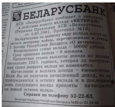
Рисунок 13. –Беларусбанк [1]

Выпуски «Новой газеты» 2006 года практически полностью напечатаны на русском языке. Газета остаётся чёрно-белой. Исключением является выпуск от 10 октября: часть текста номера напечатана голубым цветом. Экономическая реклама в выпусках 2006 года достаточно заметная, несмотря на то, что оформлена она, как и сама газета, в чёрно-белом цвете. От основного текста рекламные объявления отделены рамочкой. Большая часть из них украшена иллюстрациями. В номерах этого года активно используются рекламные плакаты. Достаточно часто плакаты используются при рекламе услуг связи. В выпуске от 15 декабря напечатана реклама сети МТС (рисунок 14) [31].