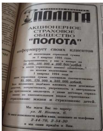
Рисунок 9. – Страховое общество «Полота»

В 1994 году экономическая реклама продолжает активно развиваться. В номерах 1994 года представлены как государственные, так и частные рекламные объявления. Внешний вид также был разным. Объявление могло сопровождаться иллюстрацией, выделяться в рамочку, отделяться прямой от основного текста. Шрифт рекламного объявления мог быть мельче или крупнее основного текста. Одно из ярких коммерческих объявлений было опубликовано в номере газеты от 26 апреля 1994 года. Реклама предлагала услуги акционерного страхового общества «Полота» (рисунок 9) [35]. Несколько частных рекламных объявлений напечатано в выпуске от 5 августа 1994 года [17]. Рекламодатели предлагают читателям приобрести своё имущество: мужской костюм, диктофон SONY, гараж в районе завода ББК.