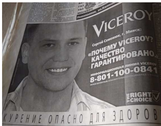
Рисунок 15. – Сигареты Viceroy [43]

А в выпуске от 6 октября 2006 года – реклама тарифного плана «привет всем» от velcom [38]. Появляется в газете и реклама сигарет Viceroy. Реклама сопровождается надписью «Курение опасно для здоровья» (рисунок 15) [43].