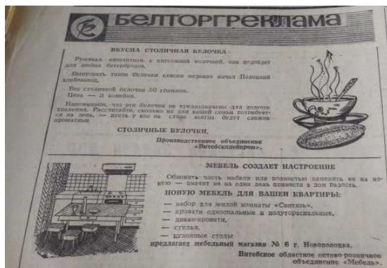
Рисунок 3. – Белторггреклама [2]

В выпусках 1985 года уже целая страница номера могла быть заполнена только рекламой. В качестве примера можно привести выпуск от 24 января (рисунок 4) [40].