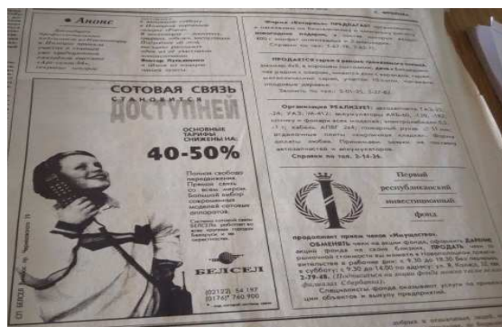
Рисунок 6. – Сотовая связь доступней [32]

Реклама в выпусках 2005 года значительно отличается от предыдущих лет. В выпусках этого года экономическая реклама встречается практически на каждой странице. Особенно много рекламных объявлений в номерах, которые содержат телевизионную программу. Ещё одна особенность 2005 года – рубрика «продам». Данная рубрика предназначалась для размещения объявлений физических лиц. В качестве примера экономической рекламы можно привести выпуск от 16 декабря (рисунок 7) [25].