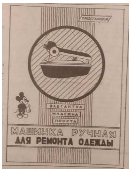
Рисунок 5. – Машинка ручная [12]