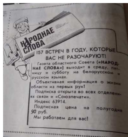
Рисунок 8. – Подписка на «Народные слова» [21]