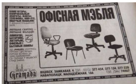
Рисунок 11. – Офисная мэбля [18]

В начале XXI века экономическая реклама продолжает совершенствоваться. Рекламные объявления были чёрно-белыми, но при этом они хорошо были заметны на фоне основного текста газеты. Большинство из них сопровождалось иллюстрациями. Одно из коммерческих объявлений было напечатано в выпуске от 12 июня 2001 года. Реклама предлагала посетить ресторан «Зодиак» (рисунок 12) [30].