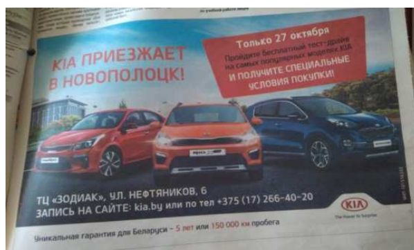
Рисунок 18. – Реклама KIA [9]

Коммерческая реклама в выпусках 2018 года яркая и запоминающаяся. В номерах появляется отдельная рубрика для частных объявлений. Реклама представлена цветными и чёрно-белыми плакатами, рекламными объявлениями, афишей городских мероприятий. В номере, который вышел 26 октября 2018 года, напечатан цветной плакат, рекламирующий автомобиль KIA (рисунок 18) [27].