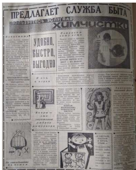
Рисунок 4. – Услуги химчистки [40]

В выпусках 1985 года уже целая страница номера могла быть заполнена только рекламой. В качестве примера можно привести выпуск от 24 января (рисунок 4) [40].