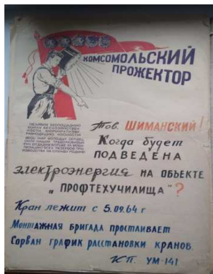
Рисунок 1. – Комсомольский прожектор УМ-141 [15]