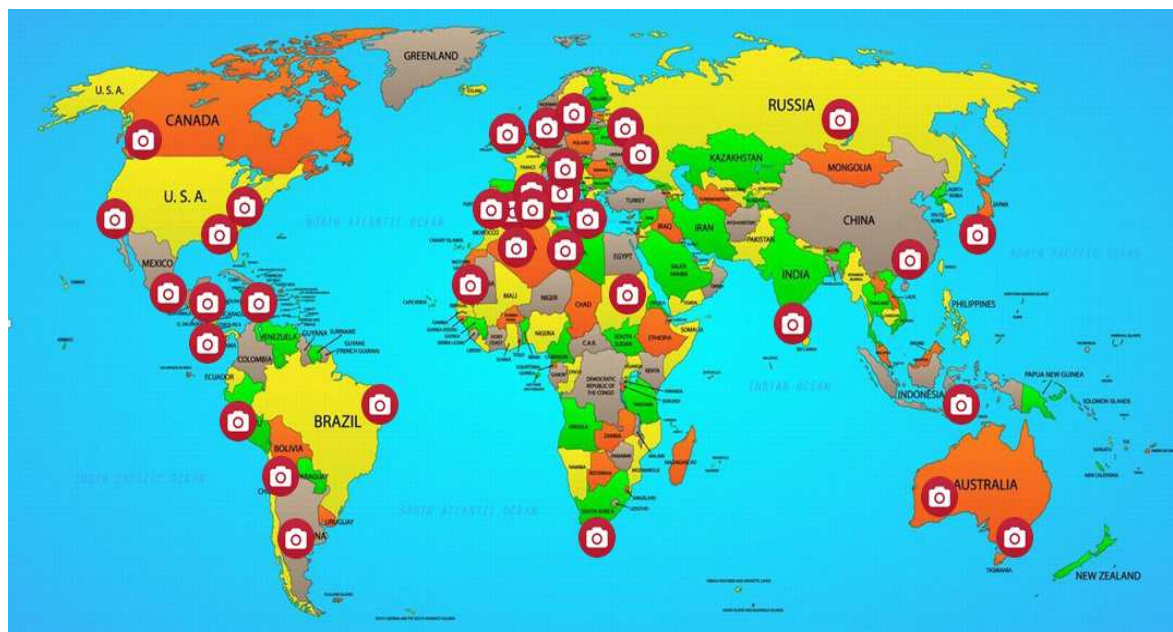
Рисунок 1. – Популярные направления в фототуризме

Что касается экзотических фототуров, то Восток – это настоящая находка для фотографов. Экзотические фототуры в большинстве случаев выбирают фотографы со средним или высоким уровнем подготовки. Израиль занимает чуть ли не одну вторую направления. Узкие переулки Яффо, пейзажи Мертвого моря, достопримечательности святой земли пользуются спросом среди фотографов. Не стоит забывать о Турции, которая также входит в список стран, подходящих для фототуризма, ведь в одном Стамбуле можно сделать тысячи разнообразных фотографий [9].