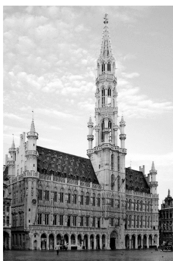
Рисунок 1. – Ратуша в Брюсселе

Наиболее полное представление о классическом образе ратуши можно получить при достаточно подробном рассмотрении примера – широко известной городской ратуши в Брюсселе (рисунки 1, 2).