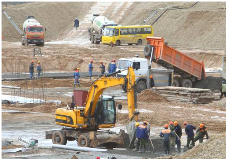
Рисунок 3. – Работа на строительной площадке Островецкой АЭС

Памятники архитектуры, археологии, садово-паркового искусства, геологические памятники природы. В городе Островец установлены памятник уроженцу Беларуси, дипломату, ученому, путешественнику Иосифу Гошкевичу, воинам и партизанам, погибшим в годы Великой Отечественной войны. Здесь также сохранились памятники архитектуры: костел святых Косьмы и Дамиана и Крестовоздвиженский костел, а также археологический памятник – земляное укрепление XV–XVII веков.