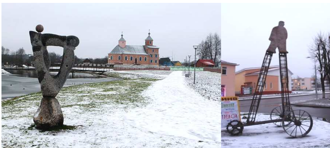
Рисунок 2. – Малые архитектурные формы

В городе Островец работает завод «Радиодеталь», действуют лесхоз, сельхозтехника, Селекционно-племенной центр животноводства, функционируют торговые, транспортные, ремонтные, дорожные и строительные организации.