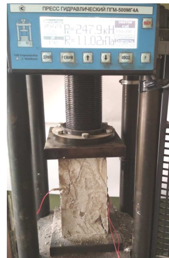
Рисунок 3 – Испытание бетонного образца с установленными в него глубинными датчиками

Из графика (см. рисунок 2) видно, что с ростом нагрузки и деформации также росли и показания вольтметра, подключенного к глубинному датчику. Из этого можно сделать вывод о том, что датчик находился в работе и воспринимал внутренние деформации бетона. Стоит отметить, что разница между нулевым и разрушающим показателем нагрузки составляет 0,303 V.