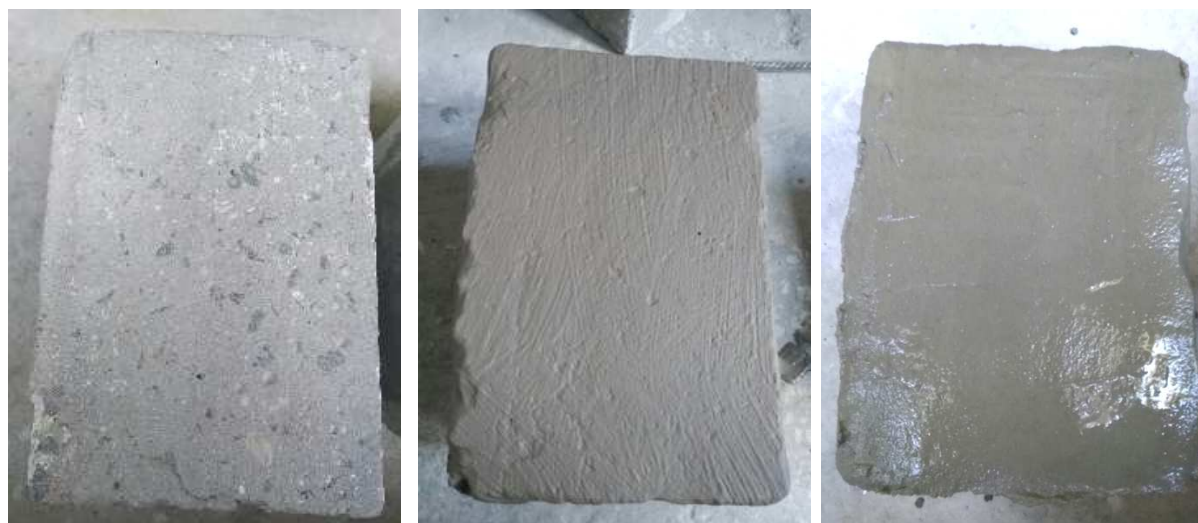
Для серии Г-1

Поверхности старого бетона перед укладкой бетона намоноличивания имели следующий вид.