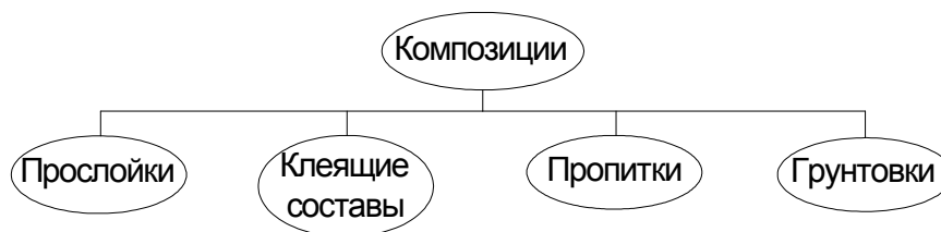
Рисунок 1. – Условное раделение композиций

Условно композиции можно разделить так, как показано на рисунке 1.