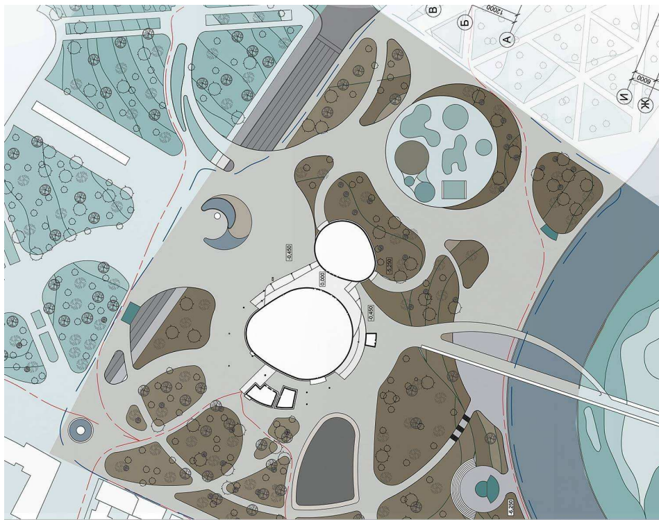
Рисунок 4. – Генеральный план многофункционального общественного центра «BRUTTO» по улице Янки Купалы в городе Минске (авторский проект)

В заключение проведенного исследования можно сделать вывод : данная предложенная разработка проекта многофункционального общественного центра, объединившая транспортную, торговую, офисную и развлекательную функции, его месторасположение, позволяет создать необходимые условия для шопинга, развлечения и отдыха жителям и гостям города.