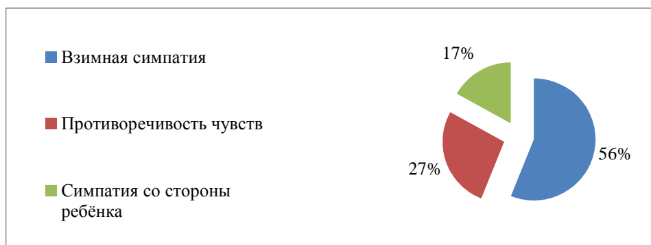
Рис. 3. Результат методики «Почта»

лей. Именно это и повлияло на высокие результаты данной методике. Полученные результаты можно изобразить графически (рис. 3).