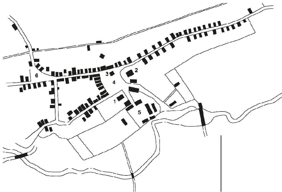
Мал. 1. Горад Ашмяны. План 1798 г.:

1 – прыхадскі касцёл; 2 – касцёл дамініканцаў; 3 – ратуша; 4 – галоўная плошча; 5 – двор старасты; 6 – рыначная плошча