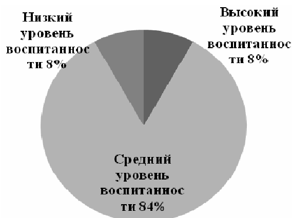
Рисунок 2 – Общий уровень воспитанности учеников 7 «Б» класса

Диагностика уровня развития ученического самоуправления выявила, что в 7 «А» он соответствует отметке низкого, а в 7 «Б» - среднего. На этом основании можно сделать вывод о зависимости уровня ученического самоуправления и уровня формирования социально-значимых качеств личности школьника. Принимая активное участие в самоуправлении школьники более дисциплинированы (в 7 «Б» 44% учеников имеют высокий уровень развитости этого качества, в то время, как в 7 «А» - 36%), отзывчивы (56% учеников 7 «Б» класса имеют высокие показатели по данному критерию, в 7 «А» лишь 38% учеников обладают высоким уровнем сформированности исследуемого качества).