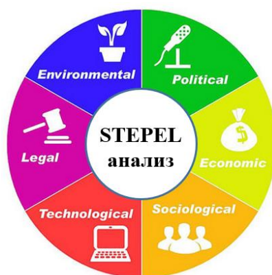
Рисунок 1. – STEPЕL-анализ факторов внешней среды предприятия

Для исследования маркетинговой среды организации СООО «Конте Спа» необходимо рассмотреть ее макроокружение, которое представляет собой факторы внешней среды, являющиеся неподконтрольными для предприятия. К ним относятся демографические, экономические, природные, научно-технические, политико-правовые и социально-культурные факторы. Для изучения и анализа факторов внешней маркетинговой макросреды проведём STEP + EL – анализ (STEP + EL – первые буквы названий групп факторов: S – social, T – technological, E – economic, P – political, + E – environmental / Ecological, L – legal) (рисунок 1).