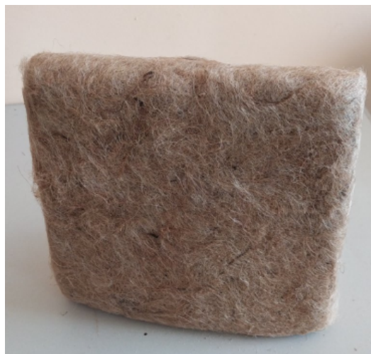
Рисунок 1. – Образец утеплителя на основе волокон джута

Среднюю плотность и теплопроводность образцов из волокон джута определяли на образцах размером 250×250×30мм (рисунок 1).