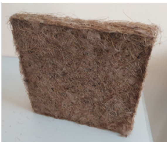
Рисунок 1. – Образец утеплителя на основе кокосовых волокон

Среднюю плотность и теплопроводность образцов из волокон кокоса определяли на образцах размером 250×250×30мм (рисунок 1), варьируя среднюю плотность образцов в пределах 70–145 кг/м 3 . В таблице 1 приведён количественный состав компонентов теплоизоляционных плит.