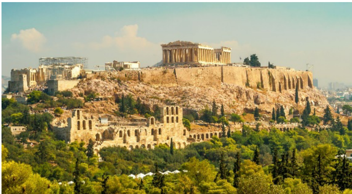
Рисунок 1. – Афинский Акрополь

Афинский Акрополь – самая известная достопримечательность в Греции (рисунок 1), которую каждый год посещают несколько миллионов туристов. Достопримечательность находится на высоте 156 м над уровнем моря и занимает территорию почти в 3 га. Он просматривается, практически, со всех точек города, так как в стране существуют ограничения на строительство зданий вблизи этого памятника архитектуры.