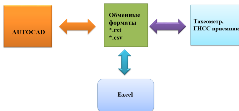
Рисунок 1. – Блок-схема работы программы

Существует множество программ для выполнения этой задачи. Практически все программы для решения данной задачи используют промежуточный (обменный) формат данных, такой как *.csv или *.txt. Это обусловлено тем, что практически все современные электронные геодезические приборы имеют возможность импорта/экспорта данных в эти форматы. Общая технологическая схема реализации этой задачи приведена на рисунке 1.